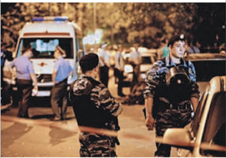
В перестрелке с опасным преступником вчера погиб сотрудник московской милиции