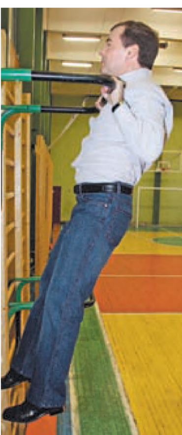
По нормативам россиянин 40–44 лет должен провисеть на перекладине не меньше 36 секунд

И: В новый комплекс вошли прыжок в длину с места, отжима-