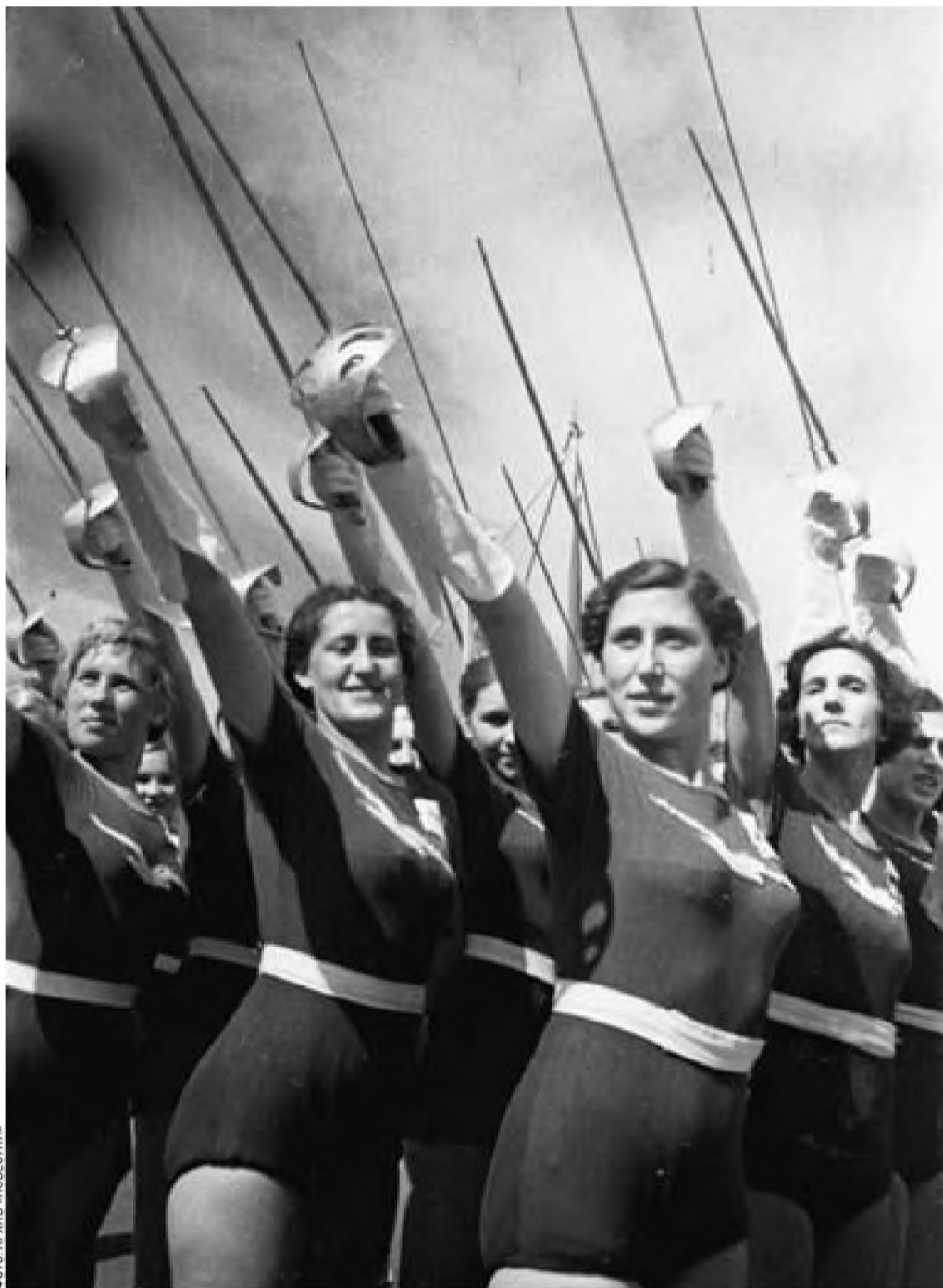
Красота — сильное оружие и без рапиры (6 июля 1939 года. Физкультурный парад колхозников Ленинградской области)