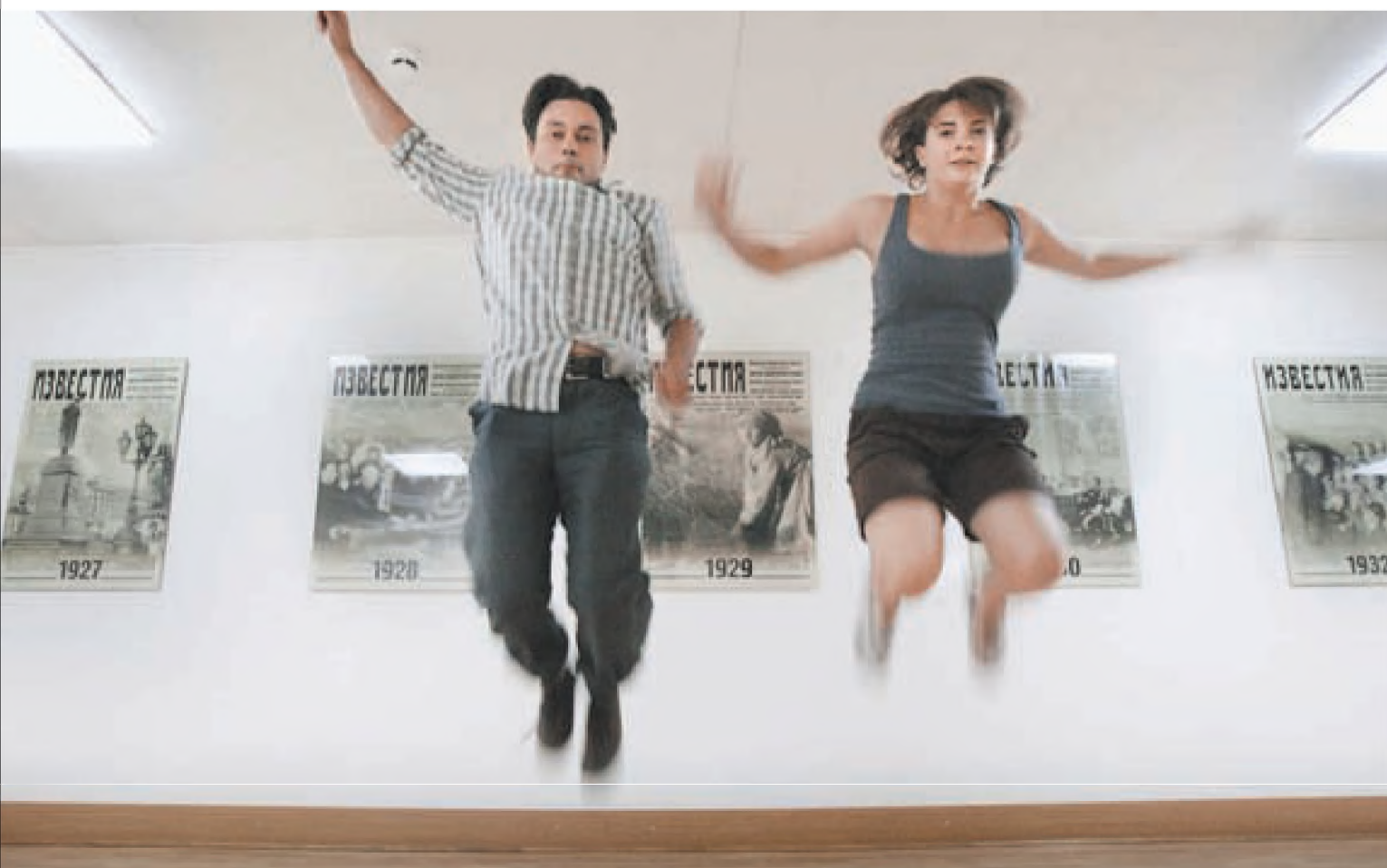
У корреспондентов «Известий» в ходе сдачи норм ГТО возникли олимпийский настрой и спортивный энтузиазм

Серьезно подготовиться к новым нормам ГТО не удалось — о предстоящем испытании узнал за пять минут до стартового свистка, приехав с очередного задания. — Сбегай пока покури, соберись, а там и начнем. — без задней мысли посоветовали заботливые коллеги. Первое испытание — отжаться 33 раза. Со школьных лет помню, что здесь главное — не частить, а там все получится. Начал удивительно легко, но после 25 отжиманий заняли руки. И все-таки испытание выдержал, хотя потом пришлось отдышаться. Курить бросить, что ли... Прыжки в длину обернулись сюрпризом — с первой попытки улетел на 1 метр 98 сантиметров. Со второй — на 2 метра ровно. Подумал, что мало, и решил заглянуть в бумаги. Оказалось, норматив в 1 метр 96 сантиметров я уже перекрыл. На третьей попытке в правом колене подозрительно щелкнуло. Ну их, эти рекорды. С «подниманием туловища» (упражнение на качание пресса) тоже справился — 17 раз не так уж и много. С «наклоном туловища вперед» — так называется тест на гибкость — тоже не было проблем. Жалко, под рукой не было турника — очень хотелось попробовать провисеть 40 секунд, упершись подбородком в турник. А вот смог бы я пробежать 1 километр за 5 минут 45 секунд, не уверен. В общем, оказалось, что в своей возрастной категории я могу дать фору многим сверстникам. К сожалению, корректно подсчитать общий коэффициент физической подготовки не получится (прошли не все тесты), но сам себе я поставил твердую четверку.