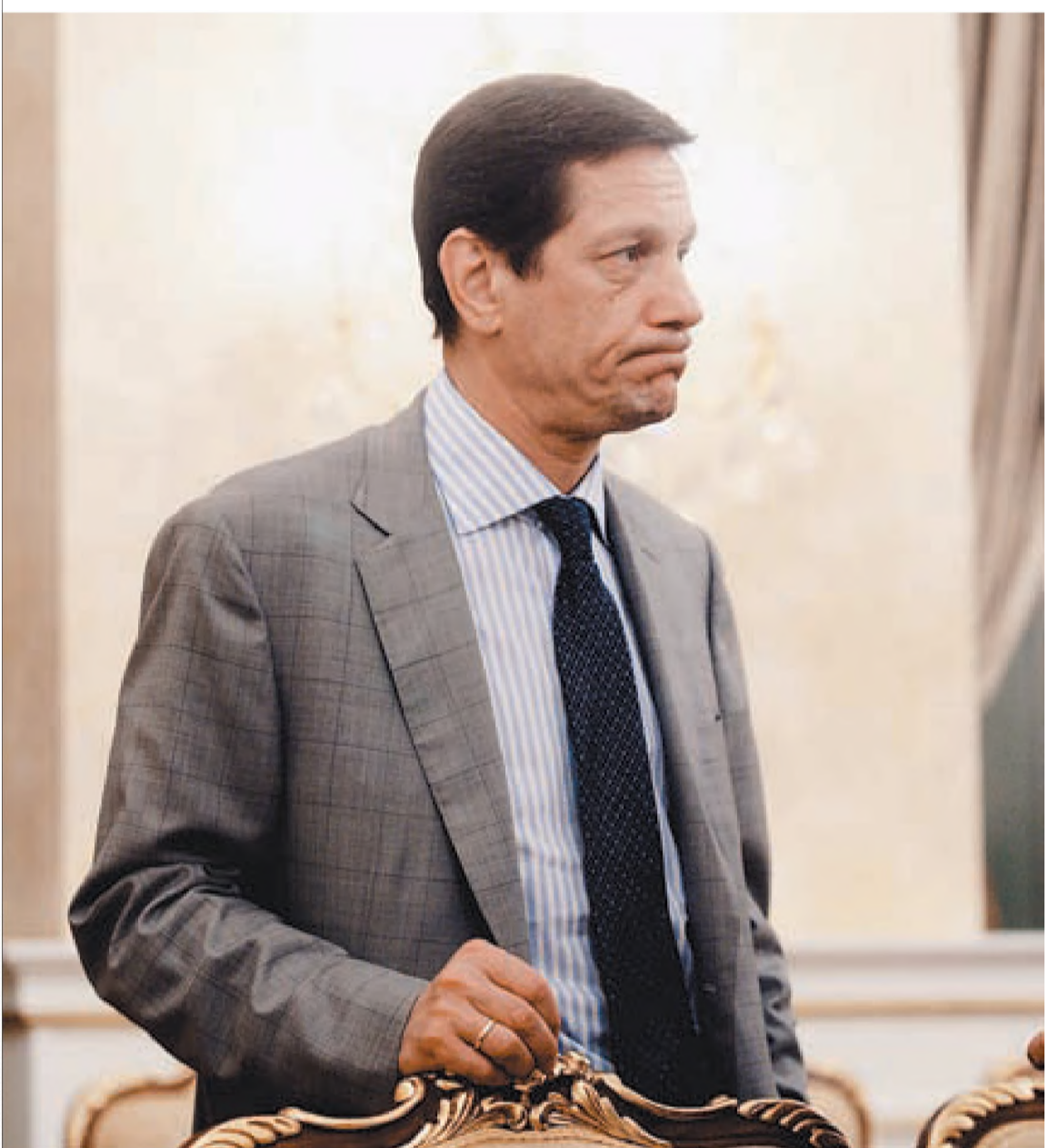
Вице-премьер Александр Жуков пообещал, что государство будет и дальше поддерживать рынок труда

Безработных в России стало на полмиллиона меньше. Вчера вице-премьер Александр Жуков подвел полугодовой итог