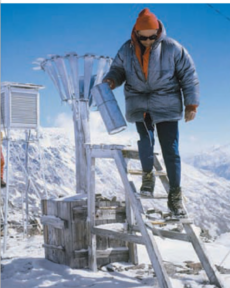
Метеорологические наблюдения всегда считались занятием трудным, но романтическим

Отечественной метеослужбе не хватает данных для качественных прогнозов