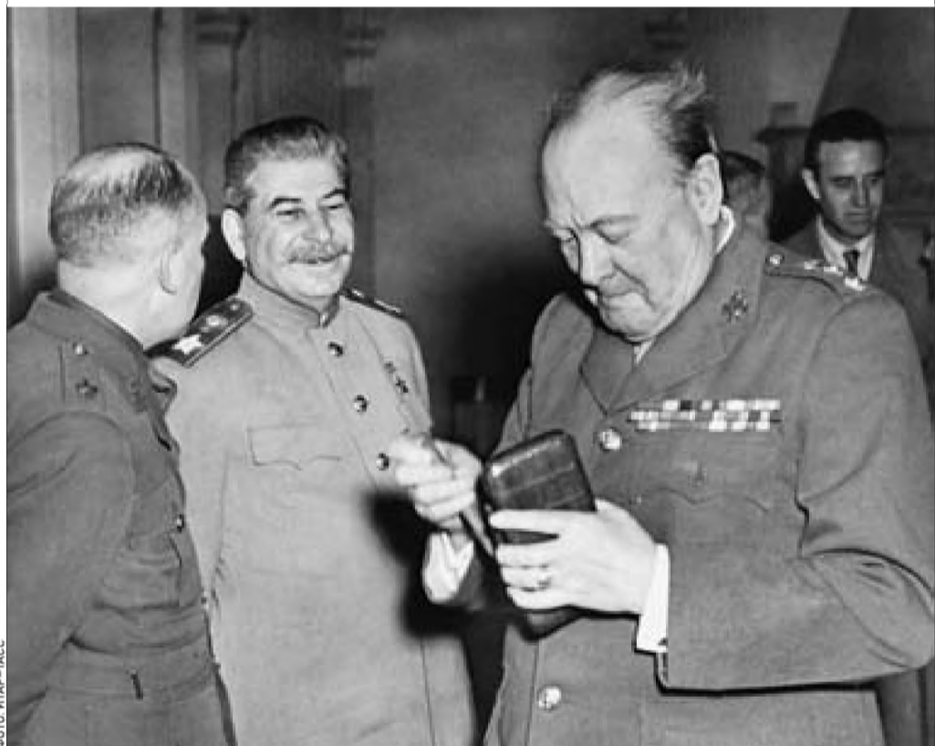
Ялтинская конференция, февраль 1945 года. Иосиф Сталин и Уинстон Черчилль перед началом одного из заседаний